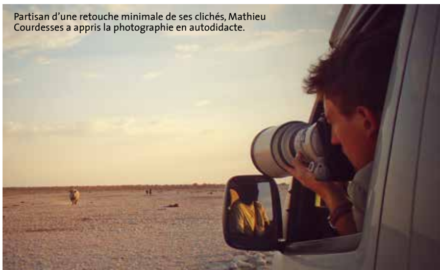
Partisan d'une retouche minimale de ses clichés, Mathieu Courdesses a appris la photographie en autodidacte.

Photografrique, les 9 et 10 septembre, salle Henri-Lasson, passage du square. mathieucourdesses.com