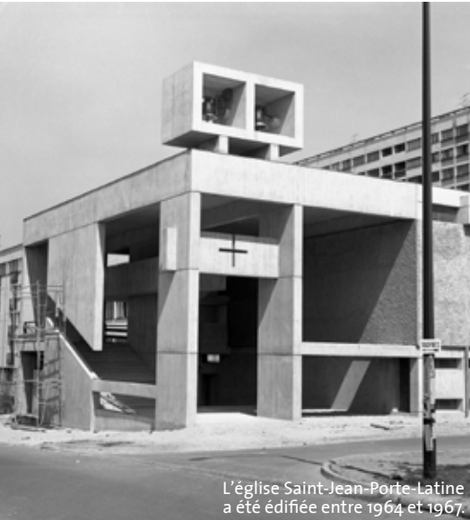
L'église Saint-Jean-Porte-Latine a été édifiée entre 1964 et 1967.

Les Journées du patrimoine, les 16 et 17 septembre, vont mettre en lumière les lieux d'histoire de la ville, comme l'église Saint-Jean-Porte-Latine. Redécouvrez ce lieu singulier.