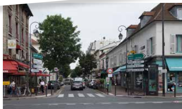
La rue Auguste-Mounié aujourd'hui, vue depuis la route départementale 920. Dans le premier quart du xx e siècle, elle était déjà commerçante et était baptisée rue de la Mairie.