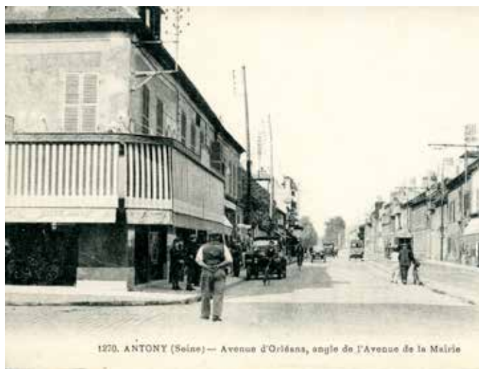
1920. ANTONY (Seine) — Avenue d'Orléans, angle de l'Avenue de la Mairie