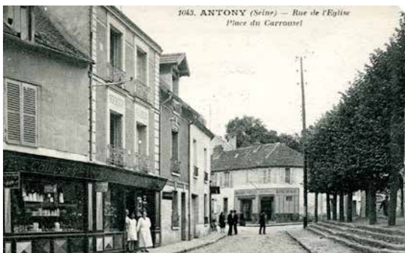
1043. ANTONY (Seine) — Rue de l'Église Place du Carrrouel