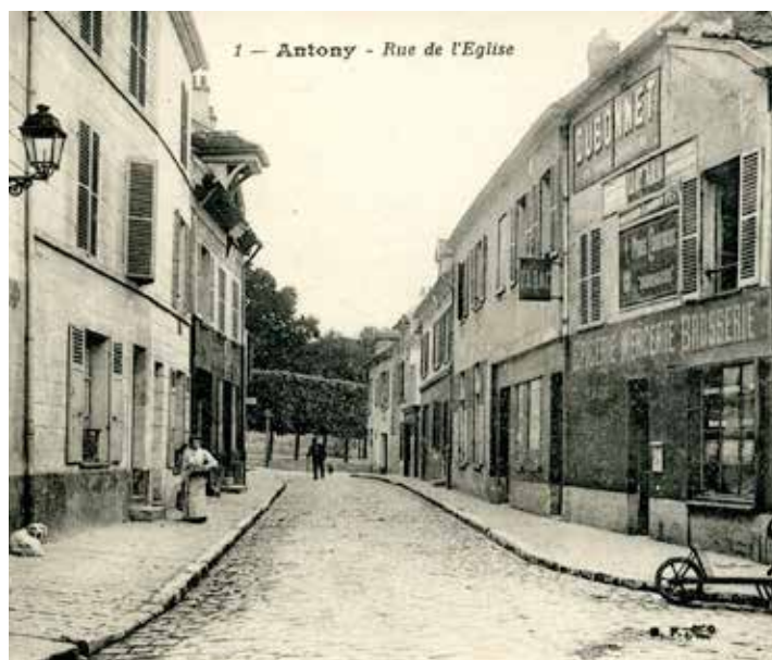
1 — Antony - Rue de l'Église