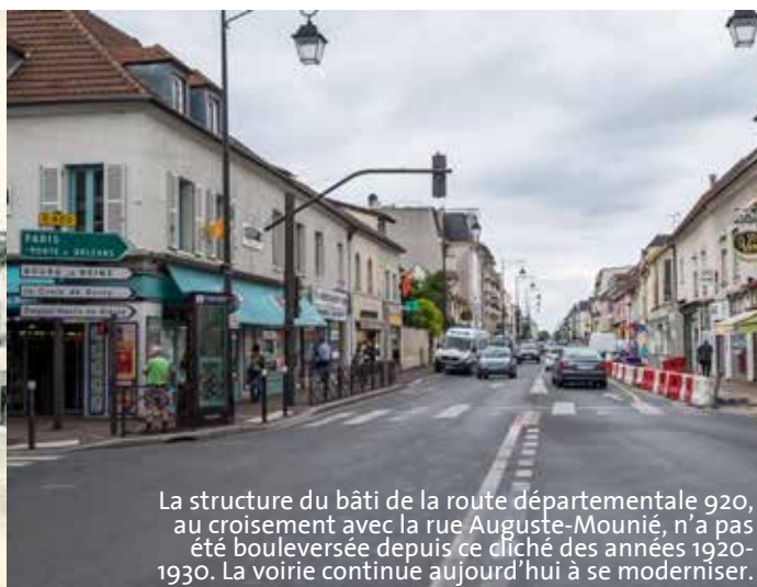
La structure du bâti de la route départementale 920, au croisement avec la rue Auguste-Mounié, n'a pas été bouleversée depuis ce cliché des années 1920-1930. La voirie continue aujourd'hui à se moderniser.

Elle est une constante dans l'histoire de la ville. La route départementale 920, qui a été baptisée route nationale 20 ou route d'Orléans dans le passé, affiche des siècles à son compteur. Cette voie, empierrée depuis l'Antiquité, représente dès le Moyen Âge et l'époque moderne un axe structurant. Elle relie Paris et Orléans, mais aussi la Seine et la Loire, très utilisées pour le transport de marchandises. Cette position stratégique en fait une route dite « royale », devenue plus tard « nationale ». À une époque plus proche de la nôtre, elle favorise l'essor démographique d'Antony. Elle accueille en effet à partir de 1893 le tramway Arpa-jonnais, qui amène vers le centre de Paris