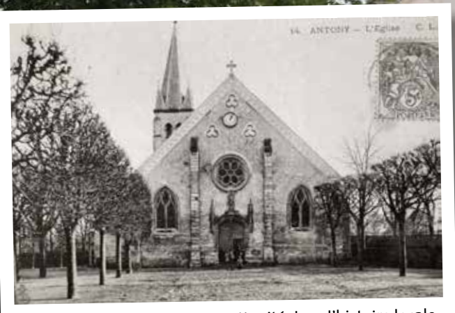
L'église Saint-Saturnin, une continuité dans l'histoire locale.