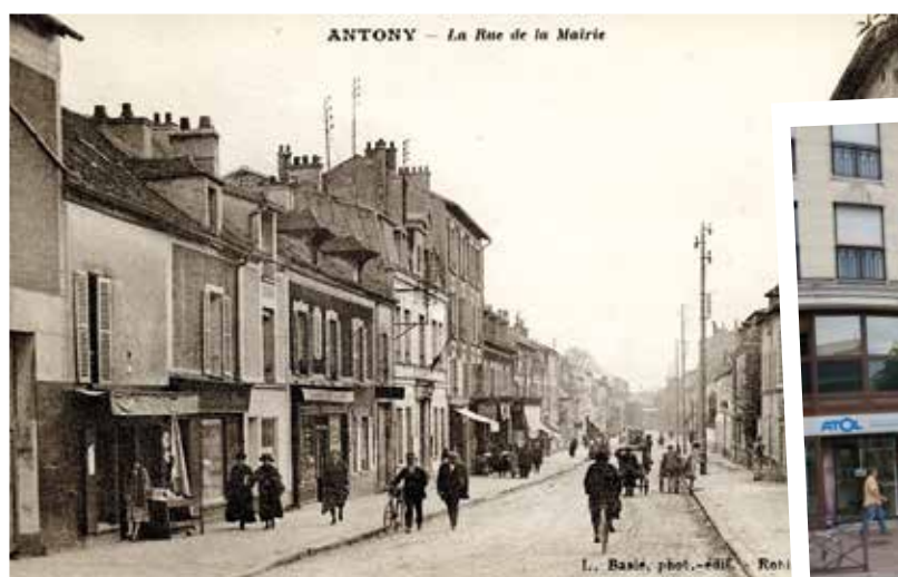
Vue plongeante sur la rue Auguste-Mounié aujourd'hui et dans les années 1920-1930.