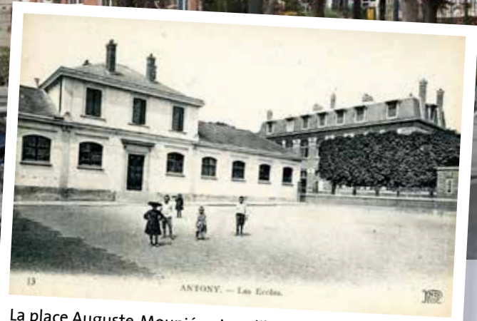
La place Auguste-Mounié aujourd'hui et dans le premier quart du xx e siècle.