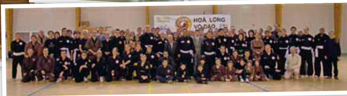
Stage à Antony de Vo CA Truyen Vietnam, le samedi 30 octobre 2010.