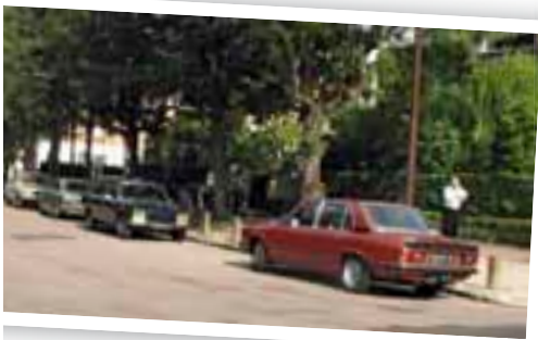
Véhicules d'époque pour Les Beaux mecs .