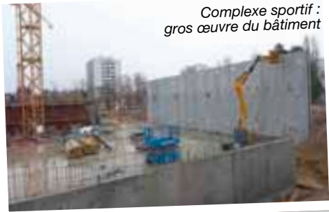
Complexe sportif : gros œuvre du bâtiment

Piscine des Iris : remplacement du réseau de chauffage et de la canalisation générale d'eau froide.