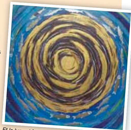
Et la lune si folle continue de tourner...

Comme tous les ans avant Noël, Laurence Moussel artiste-peintre vous ouvre les portes de son atelier le temps d'un week-end. Amateurs ou simples curieux, venez découvrir ses nouvelles peintures et nouveaux dessins, inspirés cette année encore, des poissons, de l'eau, de la lune, des champs, des couleurs, de l'ombre aussi... En cette veille de fêtes, vous y trouverez peut-être des idées de cadeaux ou de déco !