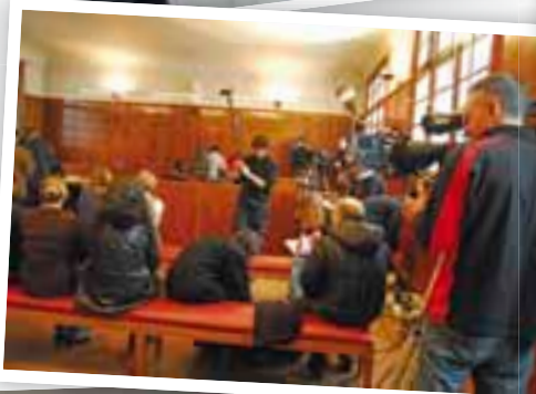
Les Bougons , tournés au tribunal d'Instance d'Antony.