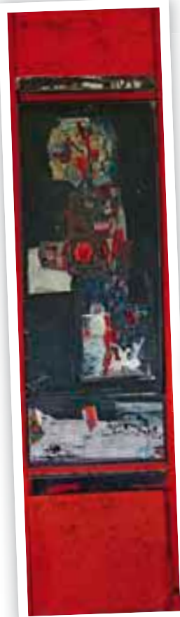
Yankel - Sans titre, technique mixte, 1990

papers...), des peintures sur carton ou sur contre-plaqué, etc.