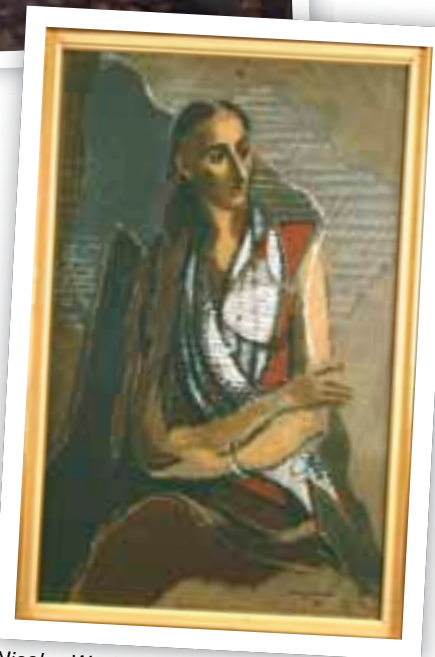
Nicolas Wacker - Anita au bracelet, huile sur toile, 1933