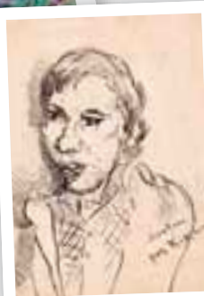
Michel Kikoïne - Portrait de Haïm Soutine, encre de chine, 1943

papers...), des peintures sur carton ou sur contre-plaqué, etc.