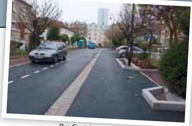
Rue Einstein : réalisation de plantations

Georges Suant : création d'une canalisation d'eaux usées.