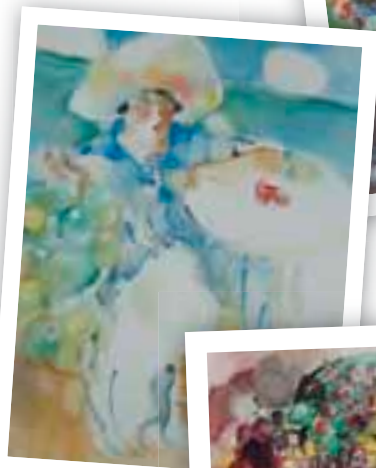
Rustam Khamdamov - Bonjour de Crimée, huile sur toile, 1995