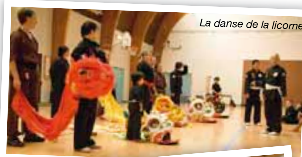
La danse de la licorne