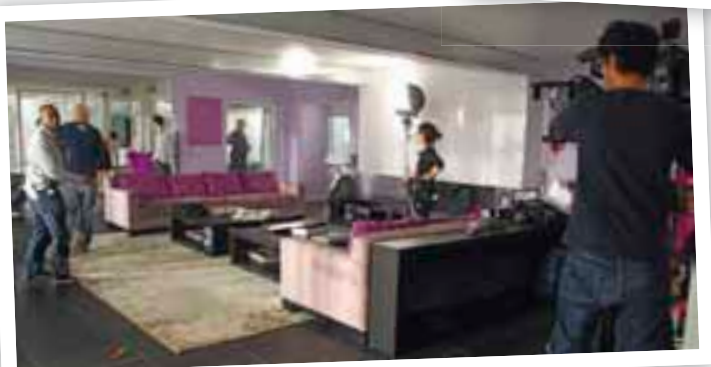
Sur le tournage de la série Boulevard du palais .