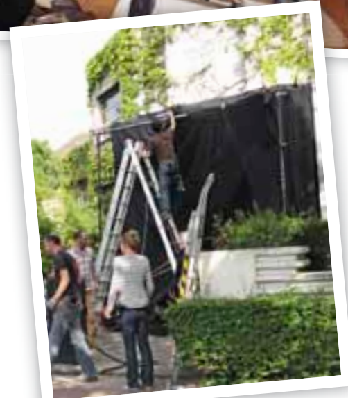
Derniers préparatifs avant de tourner une scène de nuit pour Les Beaux mecs .