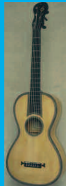
Guitare Gennaro Fabricatore, Naples 1815