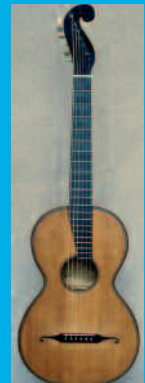
Guitare Johan Anton Stauffer, Vienne 1835