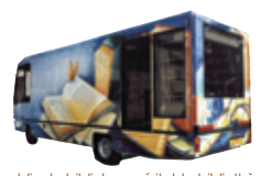
Sans oublier le bibliobus, véritable bibliothèque mobile.

CL : centre de loisirs École primaire : maternelle et élémentaire