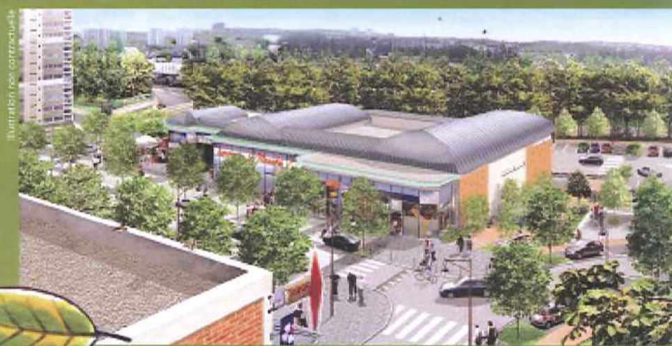
Le futur centre commercial des Baconnets

La place des Baconnets accueillera, en complément du centre commercial et des magasins actuels, 4 boutiques, une brasserie et une moyenne surface alimentaire , qui renforceront son pouvoir d'attraction. Ce nouveau centre de 1.500 m 2 , dessiné par DHM Architecture, sera construit dès l'année prochaine sur l'ancien emplacement des halles. Le parking qui occupe l'espace depuis leur destruction sera alors aménagé en sous-sol sur deux niveaux.