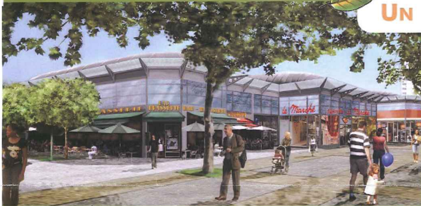
Une esquisse de la place des Baconnets à l'achèvement des travaux

Redessinée et réaménagée dans le cadre du projet du quartier du Noyer Doré, la place des Baconnets va offrir un nouveau visage : plus ouvert, plus souriant, plus agréable. Nouveaux commerces, nouveaux services, parking de 114 places en sous-sol sur deux niveaux, cheminements piétons plus sûrs, plantation d'arbres... dans son ensemble, la place des Baconnets se transforme. D'ores et déjà, certains travaux ont été réalisés. Les halles ont ainsi été détruites pour laisser place à un parking provisoire (qui sera lui-même déplacé pour permettre les travaux du centre commercial). Mais très vite, le calendrier s'accélèrera pour qu'en l'espace de trois ans la place des Baconnets devienne un nouveau centre d'échanges pour le quartier.