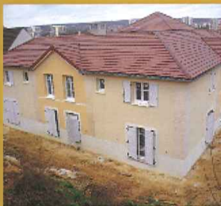
Travaux de construction du patio, rue Simone-Séailles