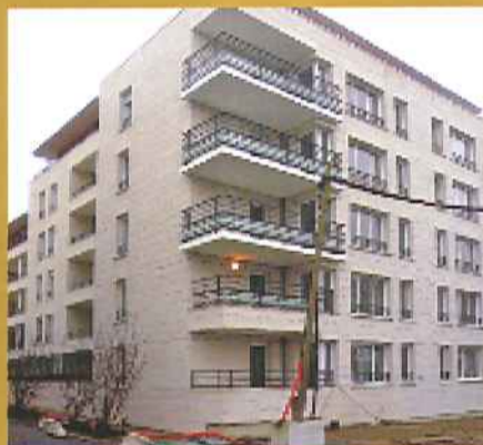
Logements OPDHLM 92 situés sur le boulevard des Pyrénées