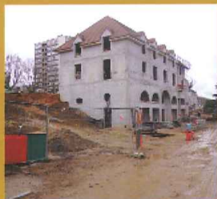
Construction des nouveaux logements donnant sur la rue de Megève