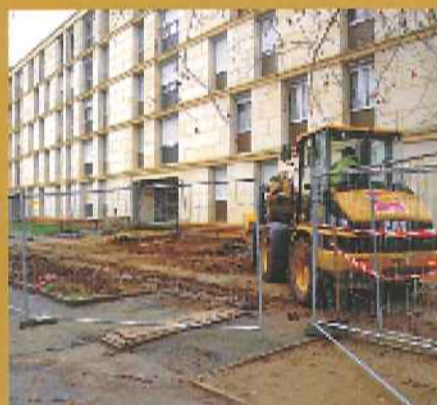
Travaux de résidentialisation allée de l'Estérel

Sur l'emprise de la tour Scherrer, démolie en 2006, de l'immeuble square du Canigou et du square des Corbières (2 et 10), il est prévu l'aménagement de l'espace public et la construction d'une résidence étudiante de 100 chambres, de 45 logements en accession sociale à la propriété et une trentaine de logements en locatif libre. Un mail piétonnier et planté traversant les deux îlots s'y étendra de l'avenue du Président-Kennedy à la rue Robert-Scherrer.