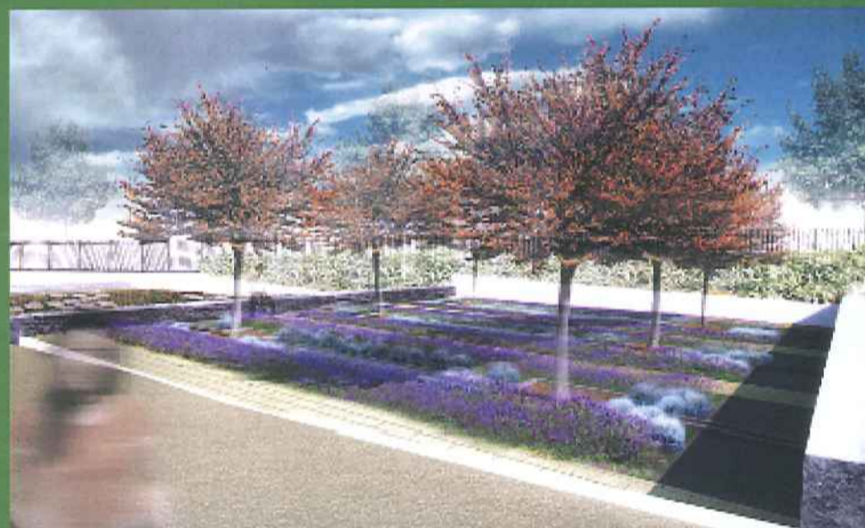
Jardin des rigoles