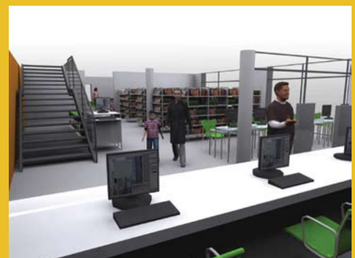
La banque d'accueil