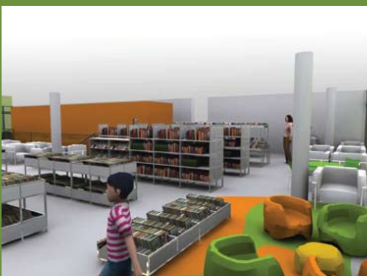
L'espace enfants à l'étage