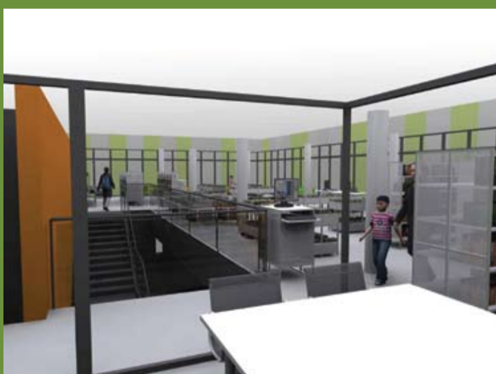
L'espace de lecture «au calme»