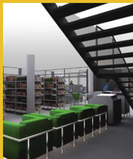
Accès à l'étage