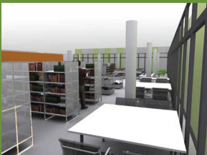
L'espace de lecture à l'étage

C. D. : Nous proposerons des activités pour tous les âges comme « l'Heure du conte » ou des « Cafés littéraires ». Grâce à une grande salle polyvalente située en rez-de-chaussée, nous allons pouvoir mettre en place des animations variées et originales comme l'organisation de conférences et d'expositions ainsi que la projection de films et de documentaires. L'idée est vraiment de faire de ce lieu, un espace de découverte et d'échange favorisant les rencontres entre toutes les générations.