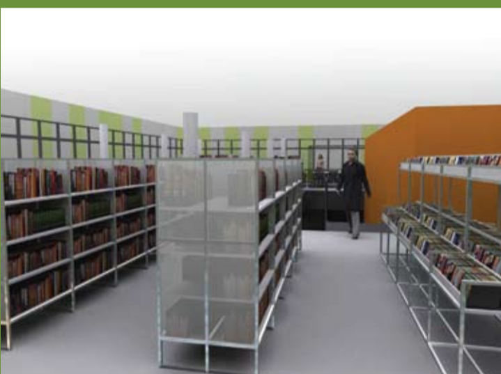
L'espace de prêt de CD et DVD