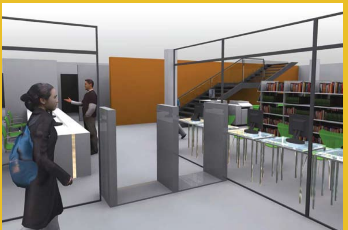
Vue sur l'espace multimédia depuis le hall d'entrée