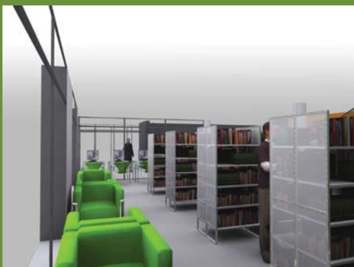
L'espace de lecture au rez-de-chaussée