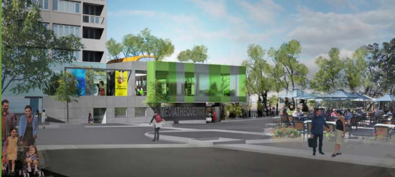
Vue depuis la place des Baconnets