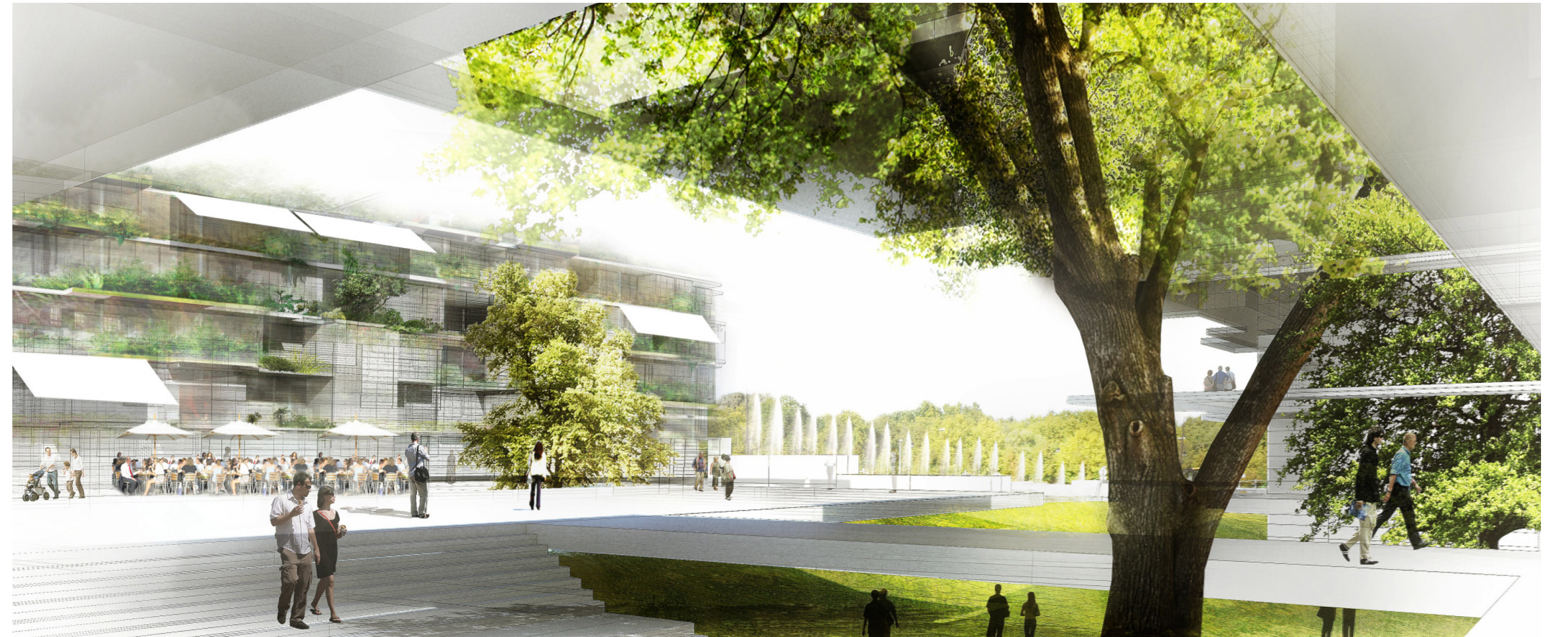
Perspective de l'Avenue du Parc de Sceaux. AJN.