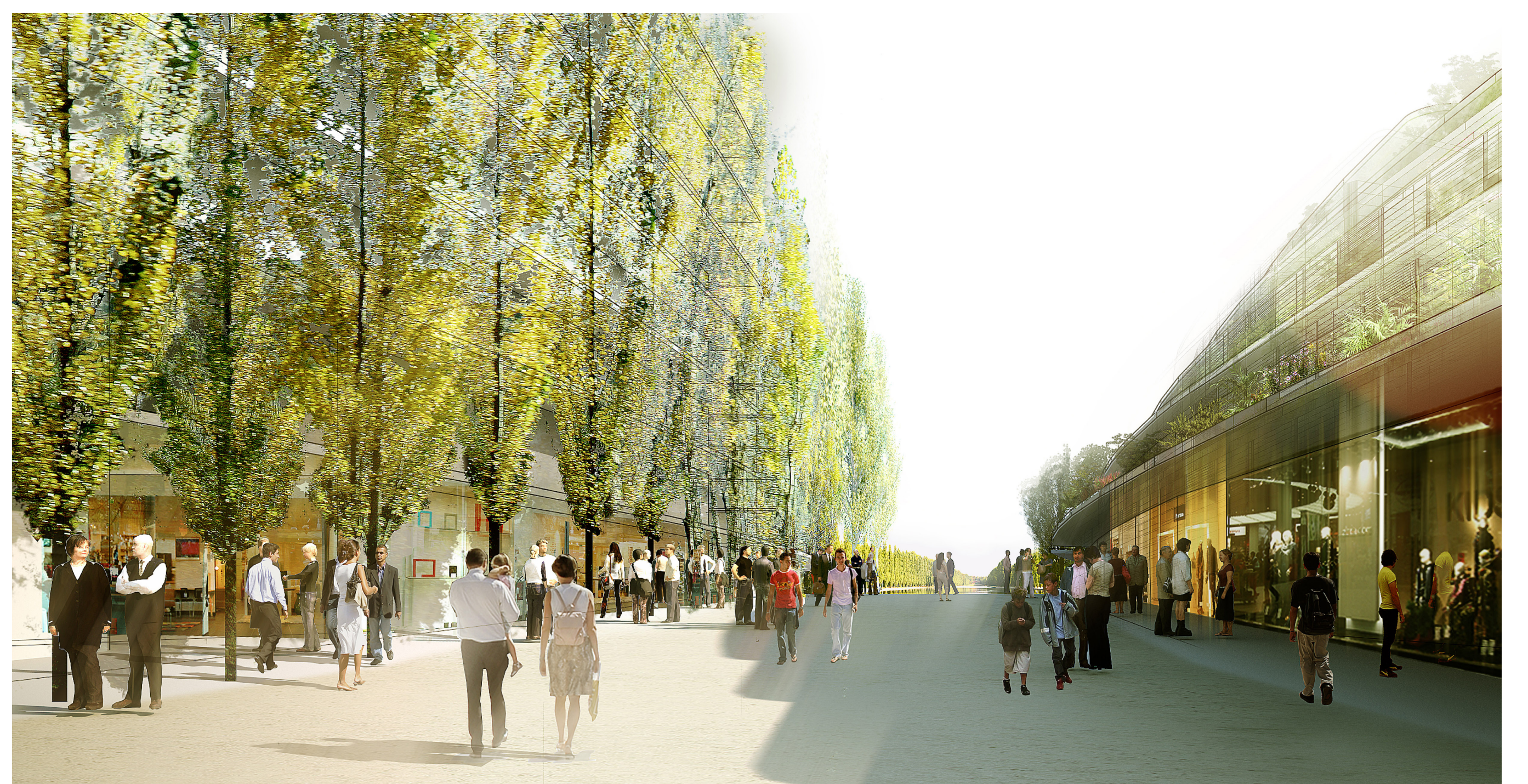
Place haute. AJN.

Suite à cette étude, la ville a décidé de lancer une concertation préalable à la définition d'un projet d'aménagement sur ce site et afin de définir la procédure réglementaire la plus adaptée. La ville souhaite s'orienter vers des objectifs très larges :