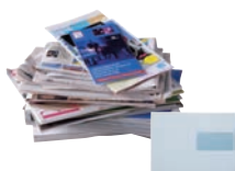
Papiers, journaux, magazines, livres, enveloppes, cahiers