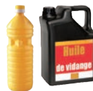
Huiles alimentaires usagées et huiles de vidange