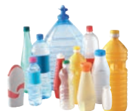
Bouteilles, bidons et flacons en plastique