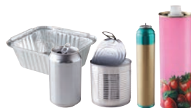
Conserves, barquettes et bouteilles en aluminium, canettes, aérosols sans symbole