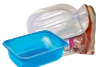
Barquettes en plastique