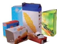
Boîtes et cartons d'emballages, briques alimentaires