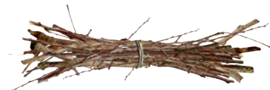
Petits branchages en fagots bien liés (moins de 5 cm de diamètre et moins de 1,5 m de long)