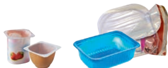
Pots de yaourt

À partir du 1 er juillet 2016, ces déchets sont recyclables !