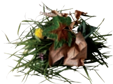
Tonte de pelouse et tailles de haie

En hiver, en raison du gel et des basses températures qui peuvent abîmer les cuves des bacs, certaines collectes sont susceptibles d'être reportées.