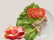
Épluchures de fruits et légumes et restes de repas, qui peuvent être compostés.