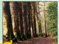
Platanes à feuille d'érable ⑥ Intérêt : leur alignement