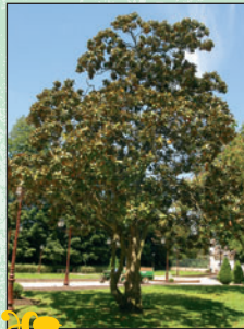
Magnolias ③ Intérêt : leur situation