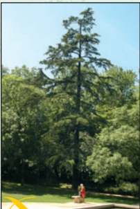
Cèdre de l'Himalaya ① Intérêt : ses dimensions