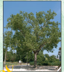
Platane à feuille d'érable ⑤ Intérêt : ses dimensions