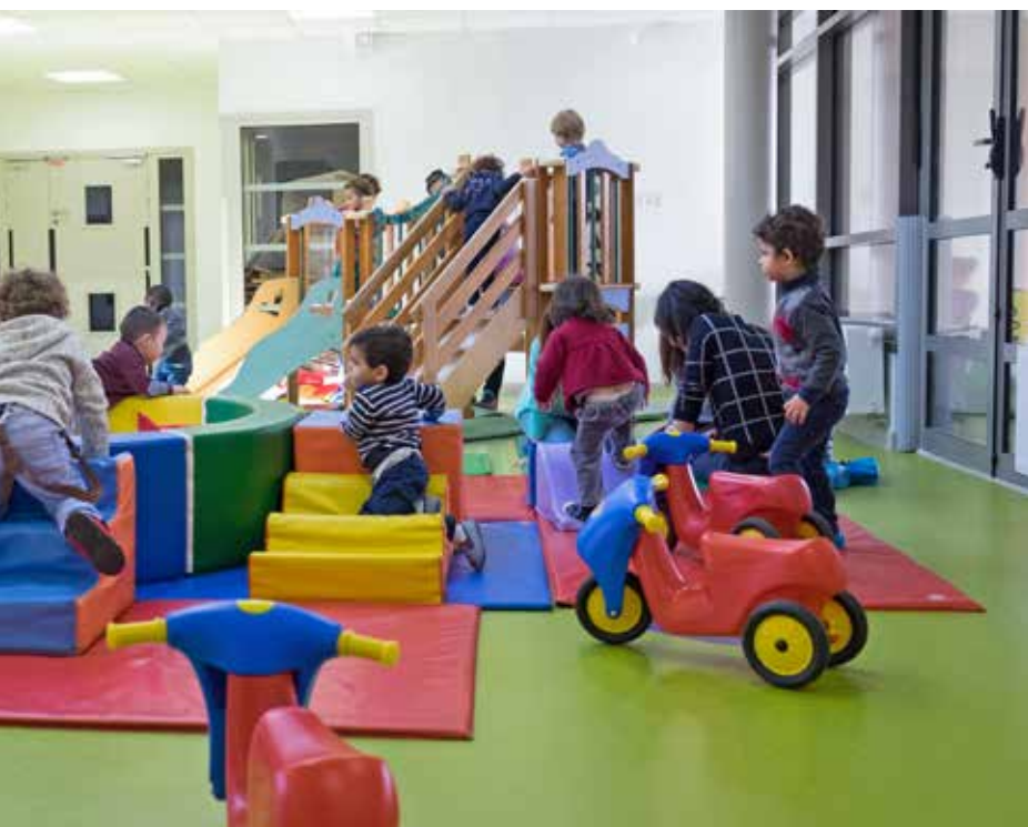
Le hall d'accueil, qui fait office de salle de motricité, est à la disposition des trois crèches.