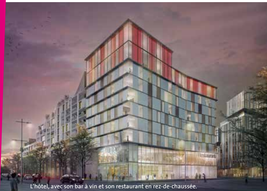
L'hôtel, avec son bar à vin et son restaurant en rez-de-chaussée.

Métro, autoroute, gare TGV de Massy, aéroport d'Orly... Antonyville se situe au cœur d'un nœud de communication. La clientèle d'affaires ne manque donc pas. Elle sera la cible de l'hôtel haut de gamme de la partie sud du site. Linkcity s'est associé à une prestigieuse école de management hôtelier, l'École hôtelière de Lausanne, pour imaginer ce projet. L'établissement comptera 150 chambres, ainsi que plusieurs suites. Il proposera à ses clients une expérience facilitée par les nouvelles technologies. Ces derniers ne seront pas seuls à profiter des lieux. Un restaurant gastronomique sera ouvert au public. Il proposera des menus différents tous les mois, notamment grâce à un partenariat avec les étudiants en hôtellerie du lycée Théodore-Monod. Un bar, associé à une cave à vins, sera installé sur le toit du bâtiment pour profiter d'une vue panoramique. Une salle de banquet et un espace également sur les toits pourront accueillir conférences, séminaires d'entreprise ou mariages. Enfin, une salle de fitness, équipée de machines dernière génération et immergée dans la végétation, occupera le rez-de-chaussée. ○