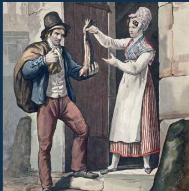
Le marchand de peaux de lapin fixait un prix en fonction de la beauté du poil de l'animal.