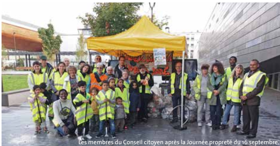
Les membres du Conseil citoyen après la Journée propreté du 16 septembre.

Le Conseil citoyen regroupe habitants et acteurs du quartier du Noyer-Doré pour améliorer ensemble leur environnement quotidien. Créée il y a un an, cette instance encore en développement a déjà lancé de nombreux projets.