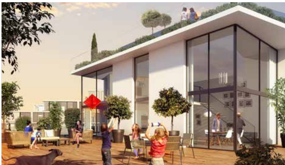
Exemple d'espaces partagés dans un immeuble d'habitations.

ONG, associations et start-up sont rassemblées pour proposer aux futurs habitants d'Antony de multiples solutions pour vivre autrement. Passage en revue des innovations au jour le jour.