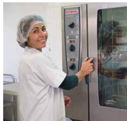
La cuisine est très appréciée du personnel.