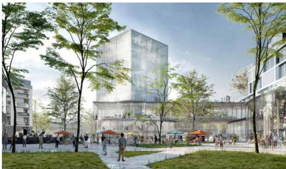
La place devant la gare et ses immeubles bordés de commerces et brasseries.