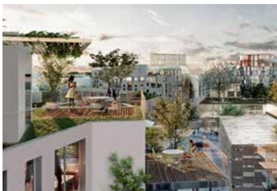
Perspective depuis un logement.

La double orientation des bâtiments garantira une bonne luminosité et une profondeur de vue. Certains immeubles contiendront aussi une chambre aménagée pour tous les résidents, pouvant être louée ponctuellement pour accueillir de la famille, héberger des amis... Pour gérer ces espaces en commun et entretenir la convivialité dans le quartier, une application mobile et un réseau intranet seront lancés. ○