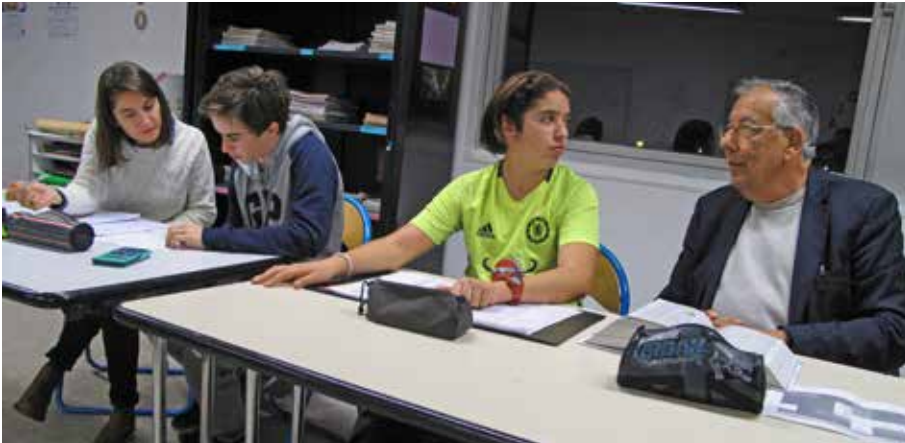
Les membres du Club ados réussite et les seniors savent installer une relation de confiance avec les jeunes dont ils s'occupent.

Le Conseil des seniors et le Club ados réussite unissent leurs savoir-faire autour d'un projet aussi innovant que séduisant : la mise en place de séances de coaching pour des jeunes collégiens volontaires. Objectif ? Les aider à se découvrir et à prendre de bonnes décisions.