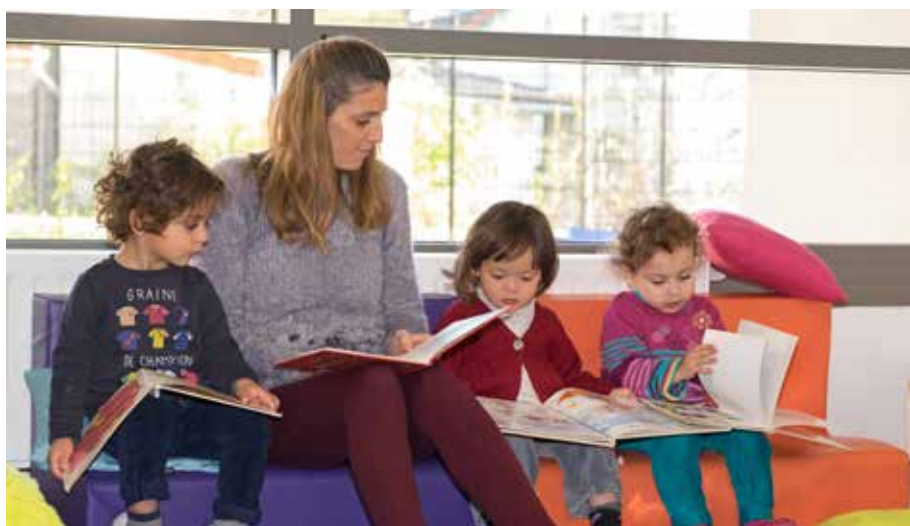
Le coin bibliothèque fait partie des nouveaux équipements dont bénéficient les enfants du multi-accueil collectif Framboisine.

Plus grand et mieux équipé, cet espace présente également une capacité d'accueil conséquente de 90 berceaux, soit un gain de 30 places. À lui seul, le multi-accueil collectif Framboisine, qui possédait une