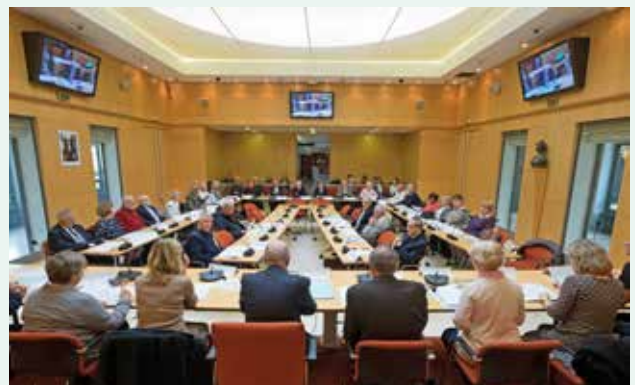
Le Conseil des seniors compte 34 membres répartis dans quatre commissions : économie-emploi-formation, urbanisme-transport-environnement-écologie, culture-loisirs-sport et santé.

Hôtel de Ville, place de l'Hôtel-de-Ville 01 40 96 72 52