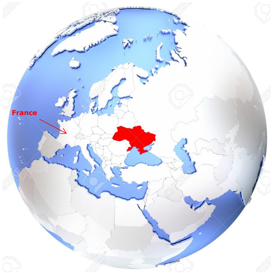
L'Ukraine dans le monde