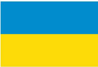
Drapeau de l'Ukraine