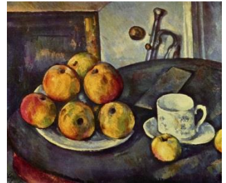
Cézanne, Nature morte aux pommes , 1894

7. À la manière d'Anne Yeremiyew, décompose toi aussi dans le cadre ci-dessous cette nature morte de Paul Cézanne (1839-1906), qui s'est aussi beaucoup amusé à métamorphoser le réel.