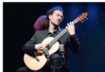
Rémi Jousset © Murielle Geoffroy