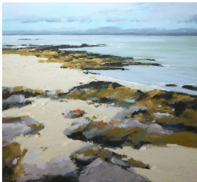
© Jean-Yves Marrec, Mer étale à Concarneau, pastel sec

Les Visiteurs pourront décerner le Prix du public 2018 qui récompense son coup de cœur parmi les artistes exposés