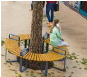
Assises autour des arbres projetées

La ville a également pris en considération le besoin d'installation de nouvelles assises autour des arbres.