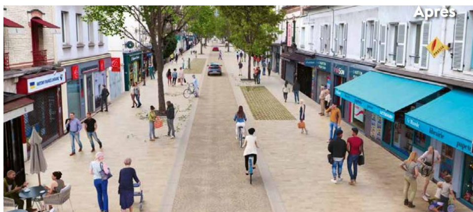
La rue Auguste Mounié projetée

Il en ressort ainsi le souhait majoritairement partagé d'avoir un centre-ville plus serein donnant la priorité aux mobilités douces au sein duquel il soit possible de flâner.