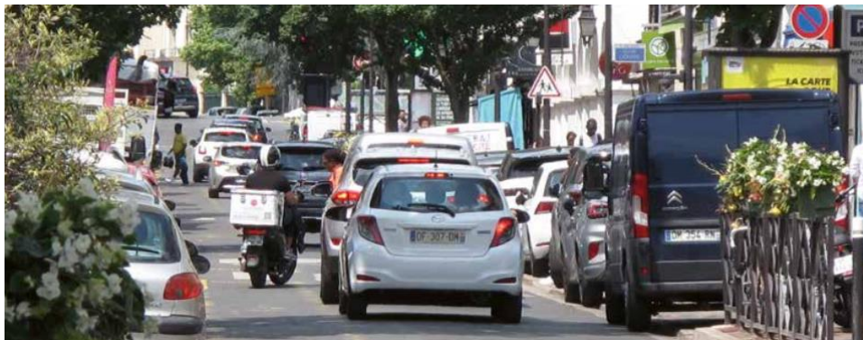
La rue Auguste Mounié actuelle

Parmi les 1 765 personnes qui ont donné leur avis lors de cette deuxième consultation 83% sont favorables au projet. Aussi, les travaux ont débuté en février 2024 et ont vocation à se terminer fin août/début septembre 2024.