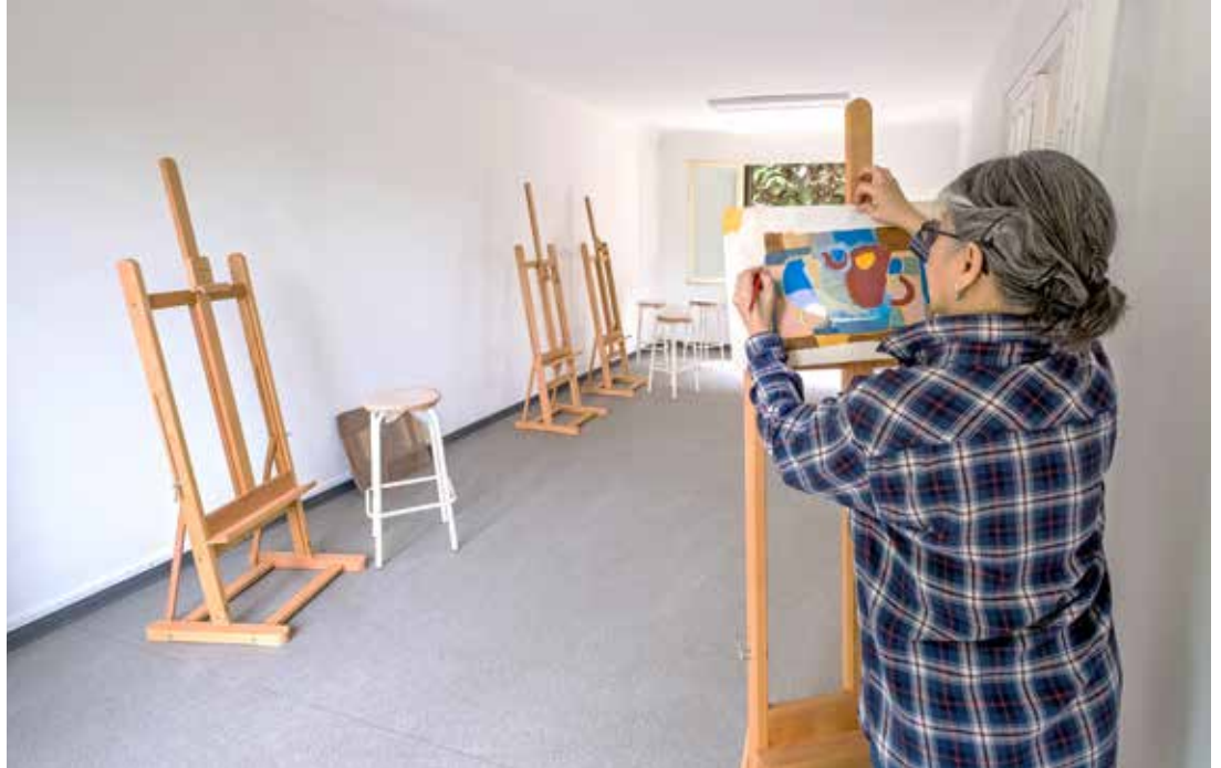
Un atelier commun de sérigraphie créera des liens entre artistes.

La Ville a transformé une maison individuelle dont elle est propriétaire en ateliers d'artistes. Ces locaux sont destinés à des plasticiens professionnels sélectionnés sur candidature. Le lieu ouvrira ses portes d'ici à la fin de l'année.