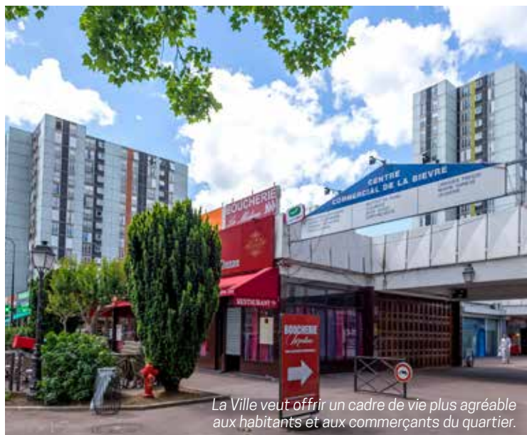
La Ville veut offrir un cadre de vie plus agréable aux habitants et aux commerçants du quartier.

des endroits, sera donc refaite à neuf. Un revêtement en béton désactivé, un matériau granuleux de qualité souvent utilisé sur les allées et terrasses, sera posé. Celui-ci est plus résistant, esthétique et antidérapant. La chaussée et les zones de stationnement avoisinantes – le nombre de places restera le même – auront aussi droit à un nouvel enrobé. Quatre bancs, des potelets et des barrières seront installés pour protéger et faciliter la circulation des piétons dans ce secteur. Durant toute la durée du chantier, la Ville maintiendra les accès aux commerces grâce notamment à la mise en place d'une nouvelle circulation piétonne. ●