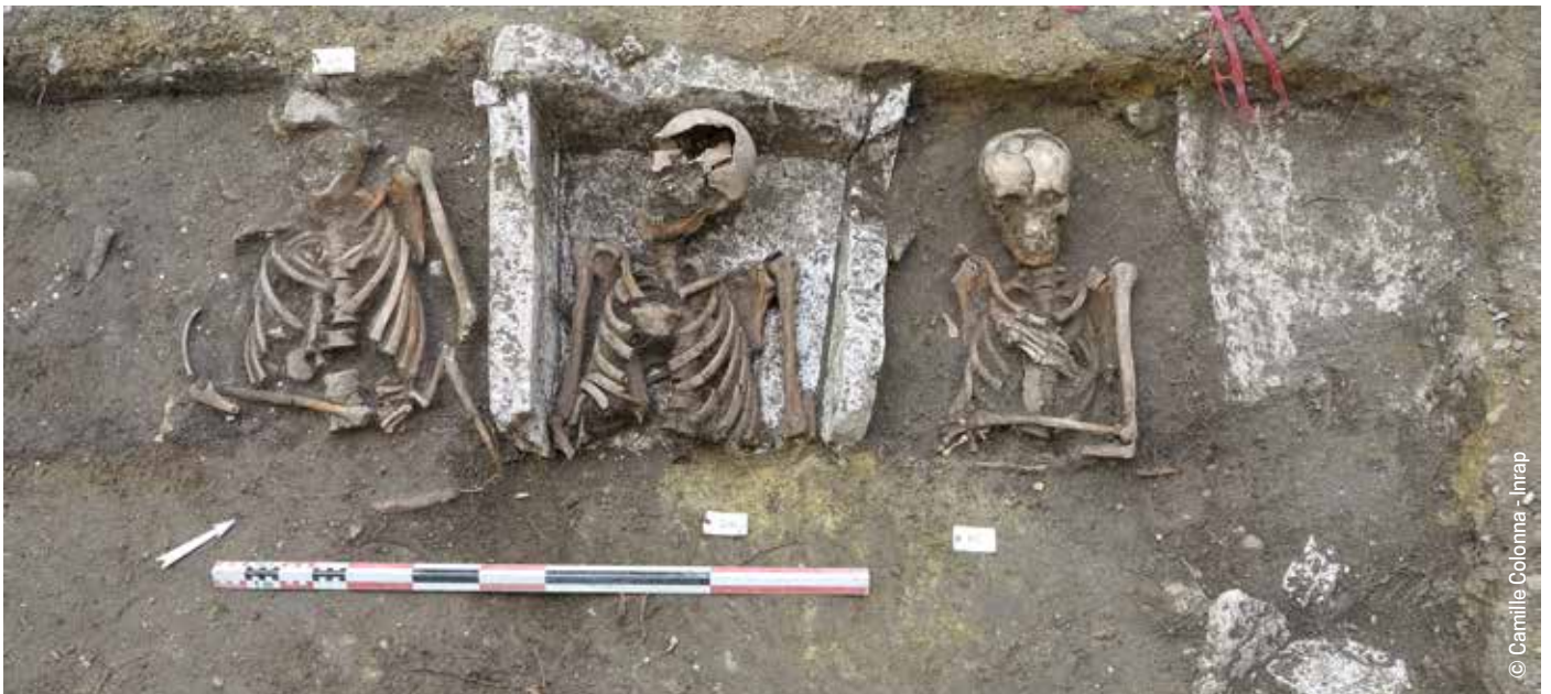
Les sépultures pourraient former un cimetière paroissial remontant à l'époque carolingienne (700-900).