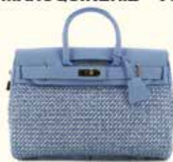
Sac Mac Douglas fantasia pyla xs pied de poule bleu

MAROQUINERIE - VOYAGE - GANTS - PARAPLUIES