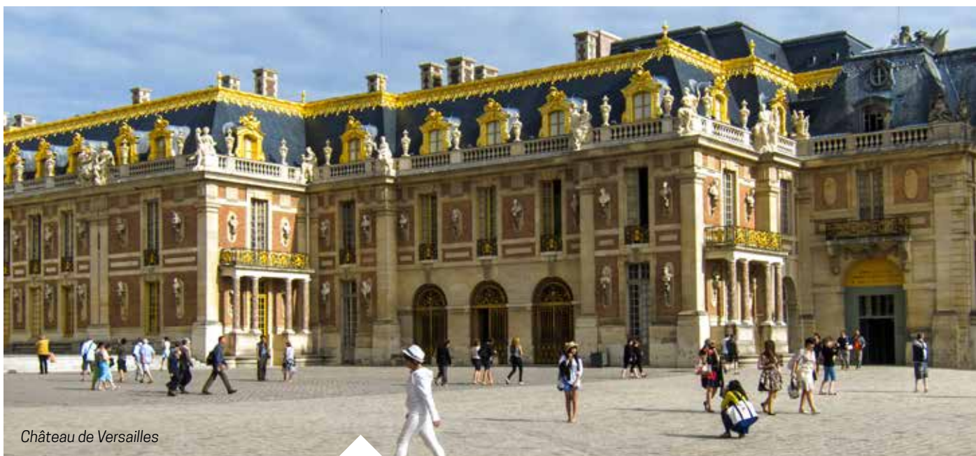
Château de Versailles

Le Centre social et culturel (CSC) n'oublie pas les Antoniens pendant les vacances. En prélude à la prochaine saison ou pour se changer les idées, une programmation pour tous les âges a été concoctée.