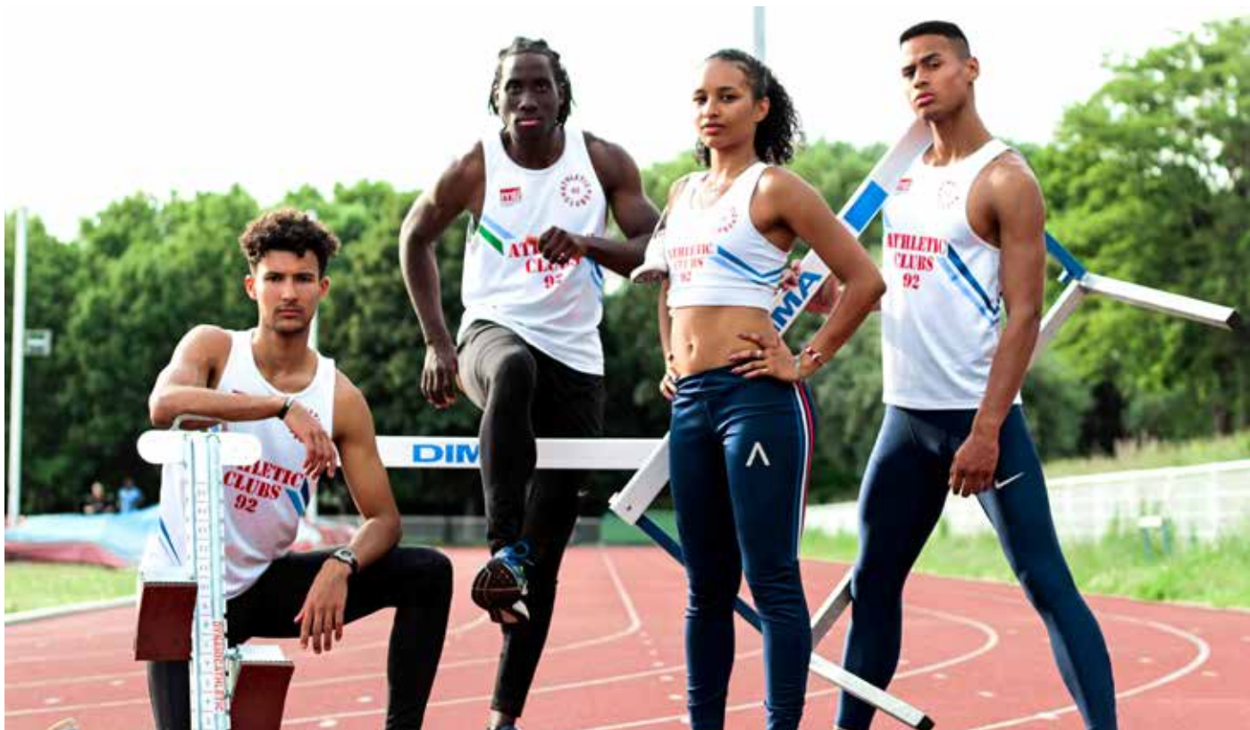
Athlétic Clubs 92 est le 1 er club du département en termes de résultats sportifs et le 4 e en France.

Athlétic Clubs 92, fruit d'une entente entre Antony et Issy-les-Moulineaux, a remporté la finale des championnats de France N1A en mai. Le club aux 1 000 adhérents, dont 600 à Antony, accède ainsi à l'Élite, le plus haut niveau. Retour sur un authentique exploit.