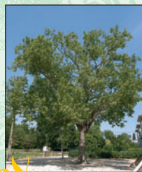
Platane à feuille d'érable ⑤ Intérêt : ses dimensions