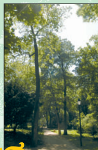
Micocoulier de Provence ④ Intérêt : ses dimensions