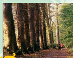
Platanes à feuille d'érable ⑥ Intérêt : leur alignement