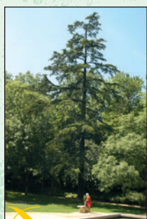
Cèdre de l'Himalaya ① Intérêt : ses dimensions