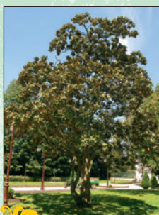
Magnolias ③ Intérêt : leur situation