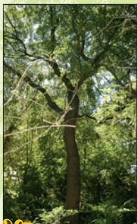
Erable de Montpellier 2 Intérêt : sa rareté

Les arbres magnifiques qui ornent le parc furent sans doute plantés, pour les plus anciens, par la famille Ballainvilliers au début du XIX e siècle. L'extraordinaire diversité des essences témoigne d'une époque où les propriétaires se livraient volontiers à une « course à la curiosité botanique ». Le parc abrite un arboretum.