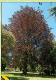
Hêtre pourpre 3 Intérêt : ses dimensions