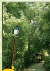
Micocoulier d'Amérique 4 Intérêt : sa rareté