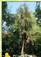
Séquoia 5 Intérêt : sa rareté