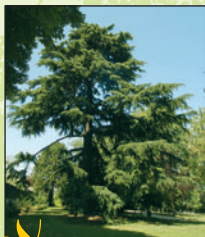
Cèdre de l'Himalaya 1 Intérêt : ses dimensions