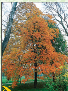
Erable d'Italie ② Intérêt : sa rareté