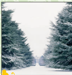
Allée de cèdres ③ Intérêt : général