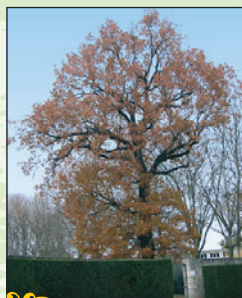
Chêne pédonculé ⑤ Intérêt : sa situation