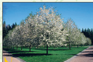
Merisier à fleurs blanches doubles ④ Intérêt : général